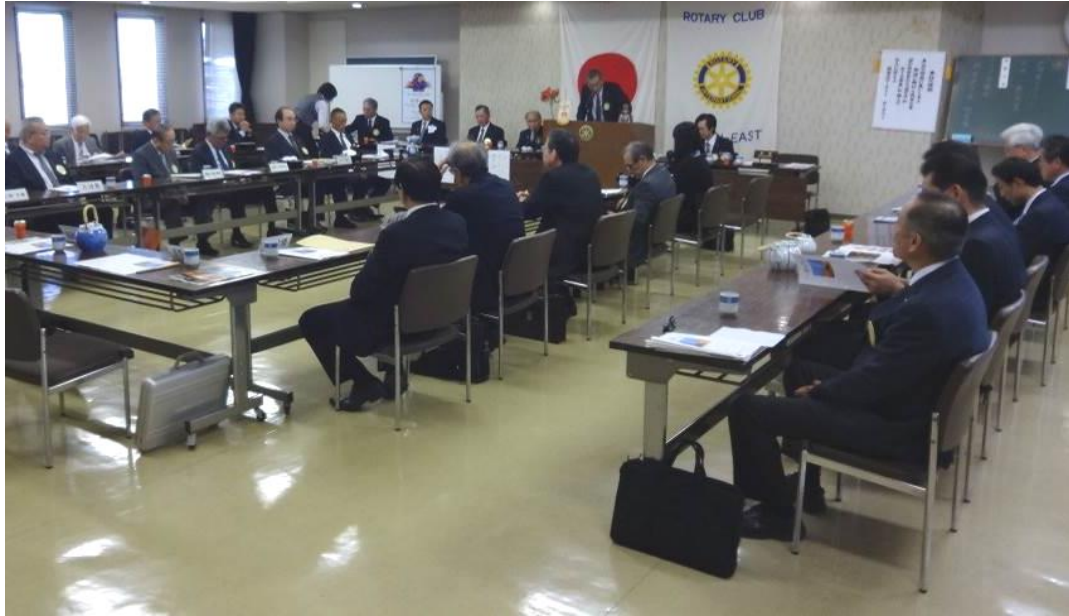
ガバナー公式訪問例会